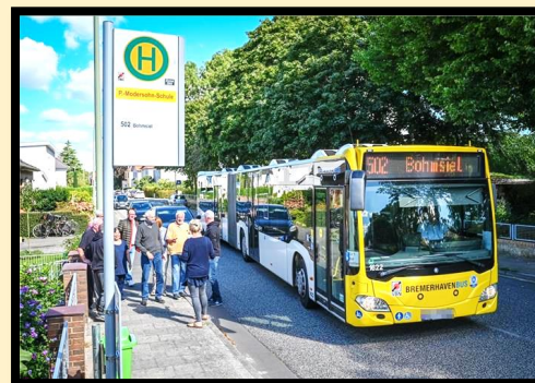
an der Bushaltestelle