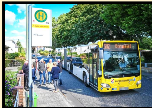
an der Bushaltestelle